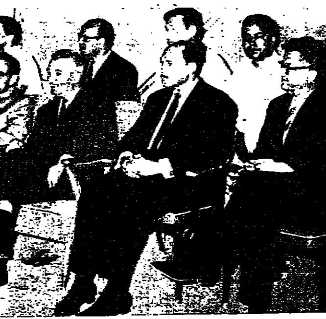
سمو الامير رعد بن زيد المدير العام مؤسسة رعاية الشباب وسيادة القريغوزان شرف الامين العام للمؤسسة واليدين عثمان نوري سفر الجمهورية العربية المتحدة وسفير بلغاريا خلال مجازاة كرة السلة امس بين فريق سبارتاك البلغاري وفريق منتخب منتخب عثمان

نيو أرك « نيجيريا » - ا.ب. - هاجم اللصوص مسلحون مصرفا وخرجوا بغنيمة قيمتها ١٥١ الف دولار وهربوا بسيارة تفويها امرأة كانت منتظراهم . واتفق اللصوص ١٨ من عملاء المصرف وموظفيه . وقال رجال الشرطة ان الغنيمة كانت مؤلفة من أوراق نقد بقيمة عشرة دولارات مما يسهل توزيعها في الأسواق دون اثاره شبيهة .